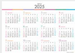
※12月裏面には年表を掲載