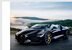
1-2月 ブガッティ W16 ミストラル