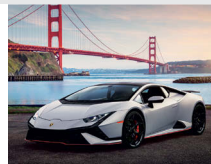
11-12月 ランボルギーニ・ウラカン・テクニカ