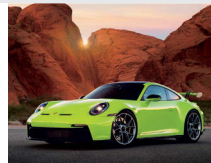
3-4月 ポルシェ 911 GT3