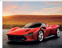
9-10月 フェラーリ・デイトナ SP3