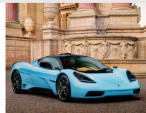
7-8月 GMA T.50