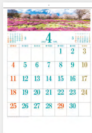
みやぎ千本桜の森公園／群馬