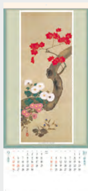
鈴木其一筆 「双鶴春秋花卉図」(左幅)