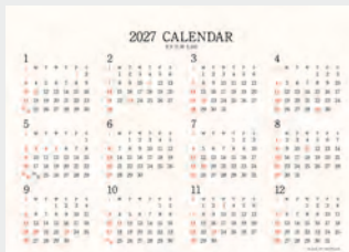
※12月裏面には年表を掲載