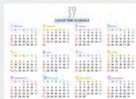
※12月裏面には年表を掲載