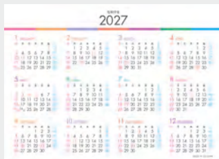
※12月裏面には年表を掲載