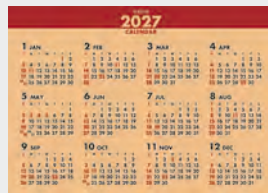
※12月裏面には年表を掲載