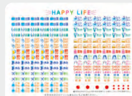
●スケジュール管理に役立つシール付き