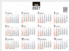
※12月裏面には年表を掲載