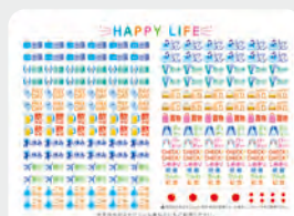
●スケジュール管理に役立つシール付き