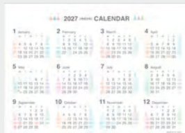
※12月裏面には年表を掲載