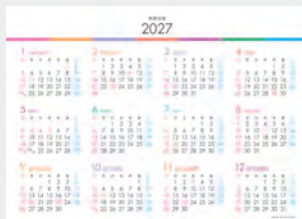
※12月裏面には年表を掲載