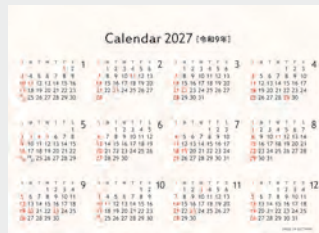
※12月裏面には年表を掲載